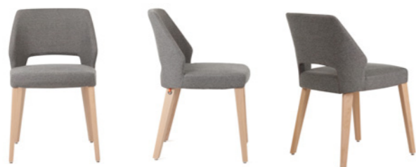
lena uni h47 PB -a