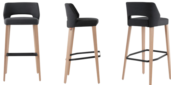
lena uni h82 PB -a

BARSTOOL LENA UNI H82 PB -A Scala linen - E24 - A01