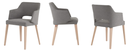
lena uni h47 PB +a