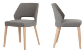
lena uni h47 PB -a