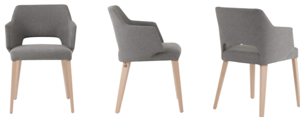
lena uni h47 PB +a