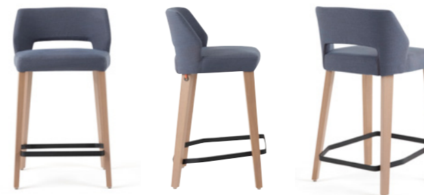
lena uni h65 PB -a