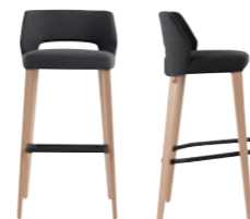
lena uni h82 PB -a (only without armrest)