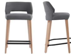
lena uni h65 PB -a (only without armrest)