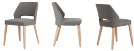
lena uni h47 PB -a