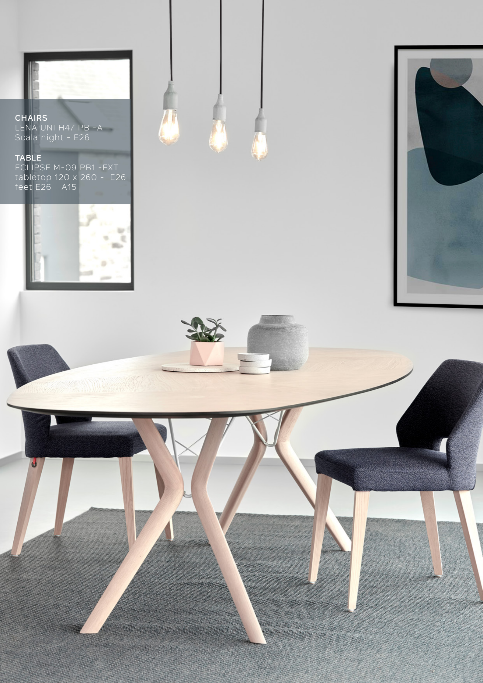
TABLE ECLIPSE M-09 PB1 -EXT tabletop 120 x 260 - E26 feet E26 - A15

CHAIRS LENA UNI H47 PB -A Scala night - E26